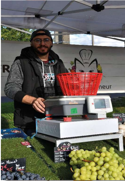
Teddy Fruits et légumes